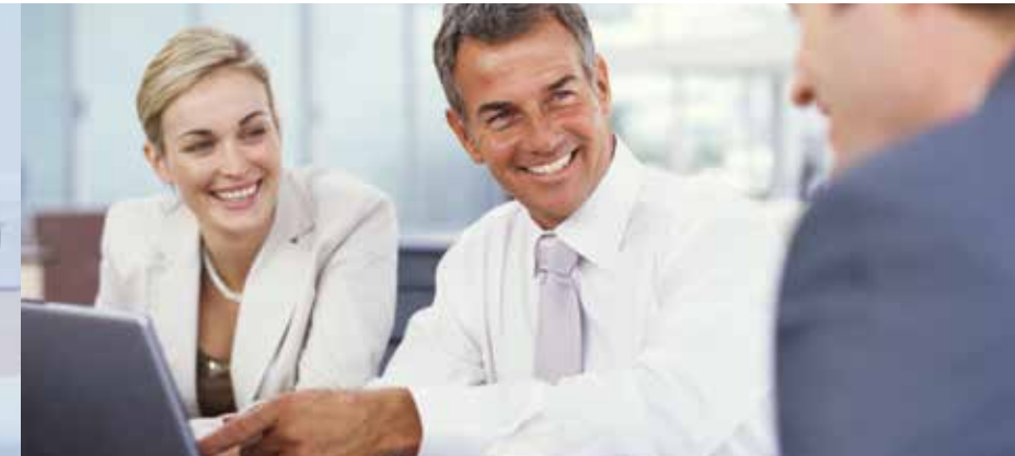
Schöne Zähne für ein charismatisches Auftreten und beruflichen Erfolg.