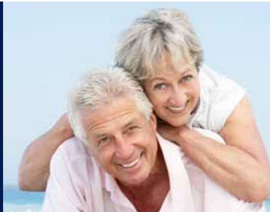
Mit festsitzenden Implantaten zu unbeschwerter Lebensfreude auch im Alter.