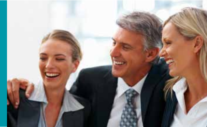
Selbstbewusstsein und Überzeugungskraft durch ein schönes Lächeln.

Ungefähr 75 % aller Patienten verspüren vor oder während des Zahnarztbesuches ein Angstgefühl und bis zu 10 % der Patienten leiden unter einer Zahnarztphobie mit extremen Angstzuständen und dem kompletten Vermeiden aller Zahnarztbesuche. Schlechte Zähne und das Wissen darum, dass man den längst fälligen Zahnarztbesuch immer wieder hinausschiebt oder vielleicht für sich schon ganz aufgegeben hat, führen zu einem schlechten Gewissen, großer Unsicherheit seine Zähne zu zeigen und damit zu einer beeinträchtigten Lebensfreude. Wer weiß, dass seine Zähne in einem schlechten Zustand sind lacht und redet nicht gerne!