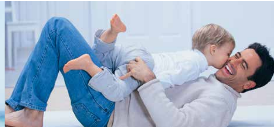
Gesunde Zähne für entspannte Leichtigkeit und einen frischen Atem.